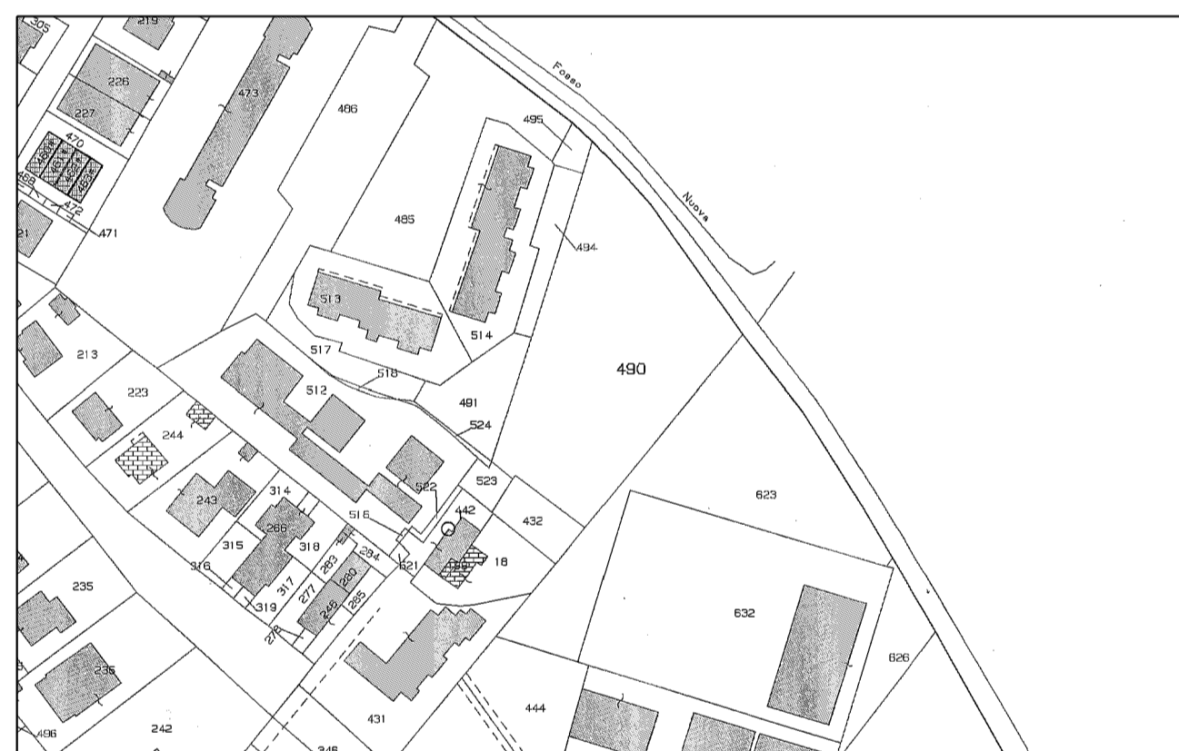
ESTRATTO DI MAPPA FOGLIO 15 -SCALA 1:2000-