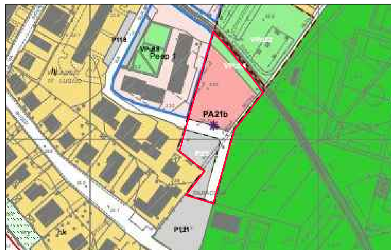
ESTRATTO DI RU -SCALA 1:2000-